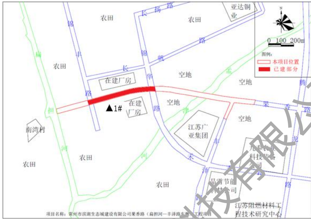
图 6-1 果香路已建部分噪声监测点位示意图